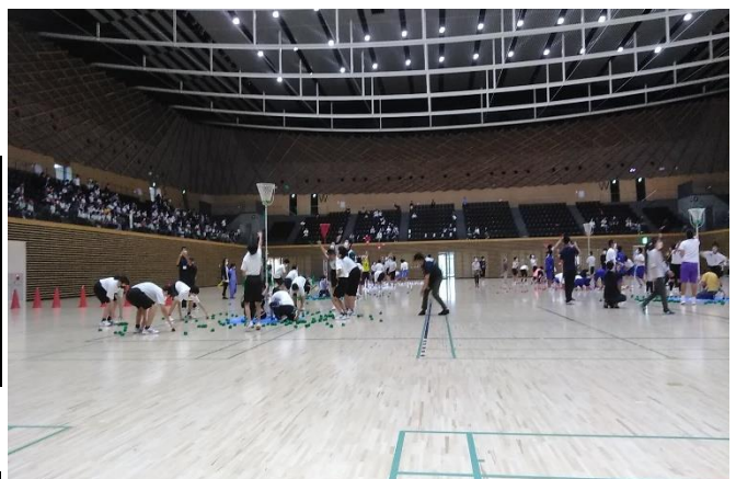
<令和4年度 三泗小・中学校 特別支援学級連合運動会>