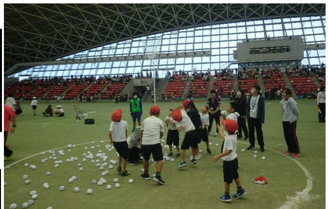
<令和5年度 三泗小・中学校 特別支援学級連合運動会>