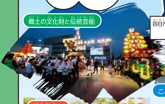
郷土の文化財と伝統芸能

毎年、大四日市まつりでは、何百年も前から受け継がれている伝統の芸能や山車や行列、そして新しく生まれた踊りや太鼓演奏などが披露されているんだ。