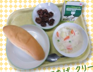
くじらの竜田あげ、クリームシチュー、コッペパン、牛乳