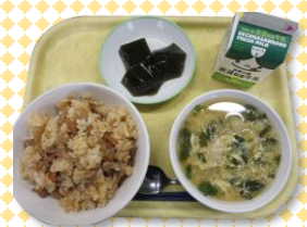
とり飯、地物たっぷりかきたま汁、手作り伊勢茶ゼリー、牛乳