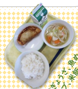
津島揚げ、豚めんのスープ、米飯、牛乳