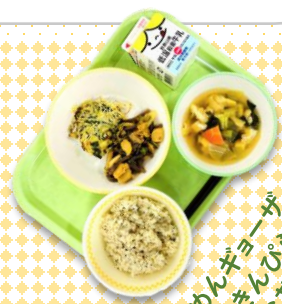
そうめん、ガヨーザ、まこもたけのきんぴら、すまし汁、四日市お茶ごはん、牛乳