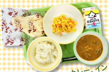
バターチキンカレー、インド風サラダ、ナン、米飯(減量)、牛乳