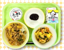
三重豚丼、豆腐の田楽みそ、白菜炊き、牛乳